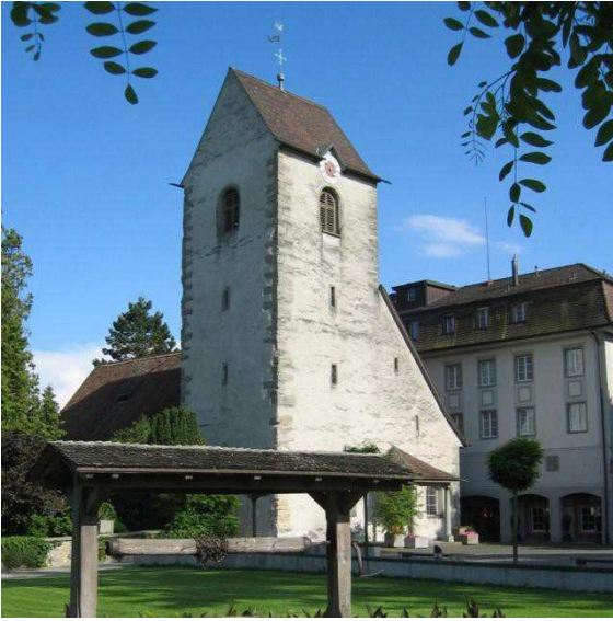
Alte Kirche mit Schloss im Hintergrund

Im Jahr 779 übergaben Waldrata, die Witwe des Zentralgrafen Waltram und ihr Sohn Waltbert den Ort «Rumanishorn» mit Kirche, Häusern, Weinbergen, Feldern, Obstgärten und einem Leibeigenen dem Kloster St. Gallen gegen einen jährlichen Zins.