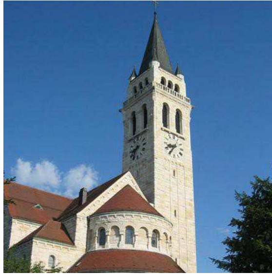
St. Johannes, Sicht vom Pfarramt aus

Romanshorn ist durch alle Jahrhunderte ein kleines Fischerdorf geblieben, bis im 19. Jahrhundert Bahn- und Schifffahrt einen ungeahnten Aufschwung brachten. Durch den Bau des neuen Hafens, die Eröffnung des Dampfboot- und Eisenbahnverkehrs wuchs die katholische Kirchengemeinde, so dass sich die Seelenzahl in 50 Jahren verzehnfachte und der Bau eines Gotteshauses in Angriff genommen wurde.