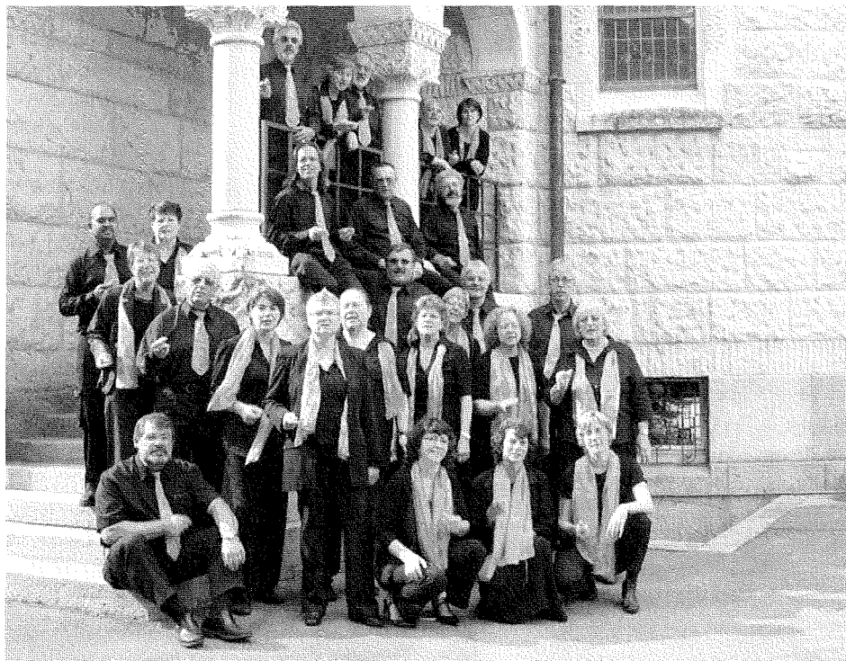
He's a friend of mine: 15. und 16. November. Der Gospelchor singt zweimal in der kath. Kirche in Romanshorn.