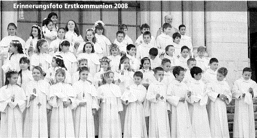
Erinnerungsfoto Erstkommunion 2008

doch Menschen zum Beispiel machen eine ganze Menge in die Höhe, Breite, Länge. Aus manchem wächst was, das ist wahr, doch oft ist er auch unbrauchbar. Auf dem Schlossberg ist das gar nicht so, mindestens Mist ist besser da als anderswo. Denn es gibt an diesem Orte eine ganz spezielle Sorte: den Kleine - Schwarze -Schweinchen- Mist! Und das Gute daran ist: Der eignet sich für jeden Garten, und man muss nicht lange warten bis sich die Früchte prächtig mehren, besonders Him- und Brom-, Johannisbeeren. Biologisch, konsistent und ohne Stroh, das mit dem Mist gilt bis auf weit'eres so. Wie man ihn bekommt, das ist nicht schwer: Vor allen anderen Dingen, sind Eimer oder Sack zu bringen. Auskunft gibt der Max, mein Sekretär!